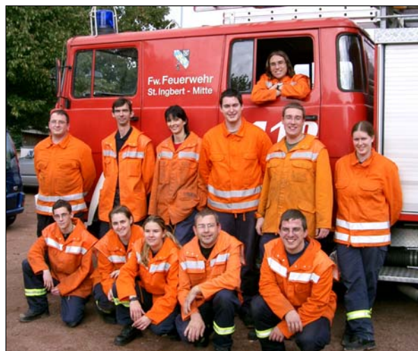
Die erfolgreichen St. Ingberter Teilnehmer aus den Löschbezirken St. Ingbert, Hassel und Oberwürzbach

Nachdem alle Gruppen die geforderten Disziplinen absolviert und die Wertungsrichter die Auswertung vorgenommen hatten, wurde in der Fahrzeughalle der Hasseler Wehr die Verleihung vorgenommen. Groß war der Jubel, als KBI Grandjean verkündete, dass alle neun teilnehmenden Gruppen das Leistungsziel erreicht haben. Er bedankte sich bei den Gruppen für die gezeigten Leistungen und das Engagement der Wertungsrichter. Außerdem dankte er dem Löschbezirk Hassel für die kurzfristige Unterstützung und die sehr gute Organisation, sowie den zahlreichen Helfern, die zum Gelingen der Veranstaltung beigetragen haben. Anschließend wurden gegen 19.30 Uhr die begehrten goldenen Abzeichen und Urkunden von KBI Grandjean und Hauptwertungsrichter Stalter an die Teilnehmer verliehen. Bei einem gemütlichen Beisammensein klang der anstrengende Tag aus. Ab dem nächsten Jahr gibt es ein neues saarländisches Leistungsabzeichen des Landesfeuerwehrverbandes. Parallel hierzu besteht dann zum letzten Male die Möglichkeit das bisherige goldene Leistungsabzeichen, dessen Trägerschaft beim Innenministerium liegt, zu erwerben. – J. Schneider –